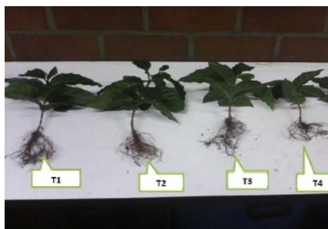
Figura 3. Desarrollo vegetativo de plantas de café catimor en vivero.