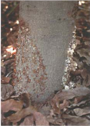
▲ Tronco del árbol con síntomas del hongo "Phytophthora citricola." Observe el azúcar que sale del tronco. Tree trunk with symptoms of Phytophthora citricola . Note the sugar exudates.