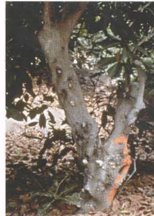
▲ Las infecciones de la úlcera bacteriana causan depósitos blancos de azúcar en el tronco. White patches of sugar on the trunk caused by bacterial canker infections.