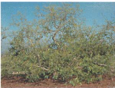
◀ Árbol de aguacate muriendo por el hongo "Phytophthora cinnamomi." Avocado tree dying from Phytophthora cinnamomi .