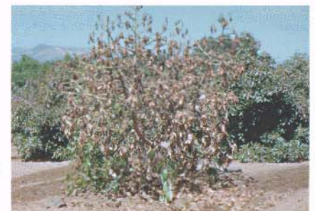
▶ El hongo "Verticillium" causa que el árbol se marchite. Wilted tree caused by Verticillium albo-atrum .