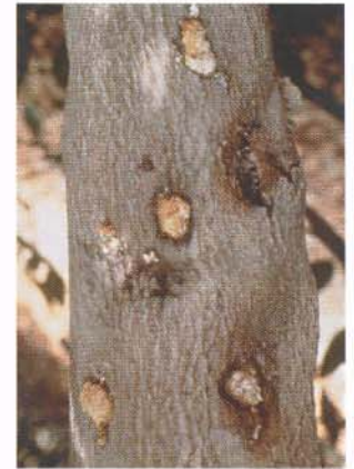
▲ Una úlcera bacteriana magnificada. A close-up of a bacterial canker.