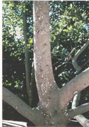
▲ Los síntomas de raya negra; la causa es desconocida. Symptoms of black streak; the cause is unknown.